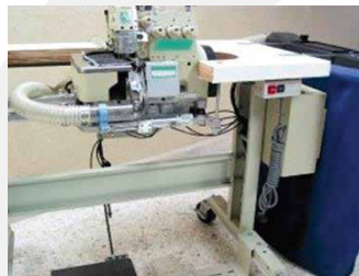
EQUIPO DE SUCCIÓN TEMPLEX