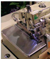
CORTADOR NEUMÁTICO DE CADENA K1