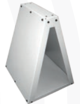
Base de apoyo.