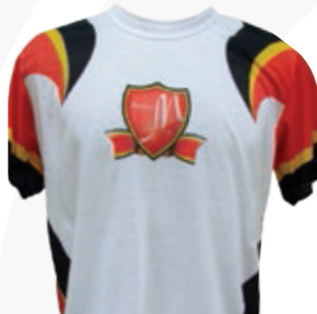
Ejemplo de aplicación en ropa deportiva.

AUMENTE SU PRODUCTIVIDAD CON LAS VERSIONES AUTOMÁTICAS