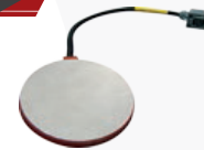
Forma para platos.