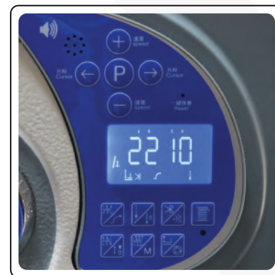
Panel de control