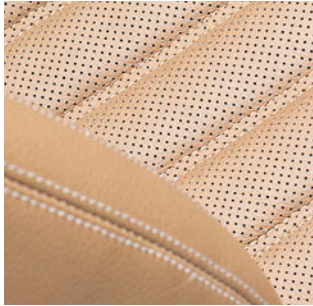
Asientos de automóviles