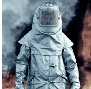
Ropa de protección