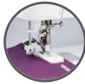
Ojal automático en 1 paso