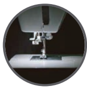
Luz blanca LED

Funda cubre máquina, prensatela para ojal, cierre, botón, guía de costura, carretes, agujas, desarmador, aceite, brocha y descosedor.