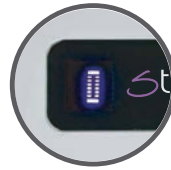
Visor de puntada BackLight LED