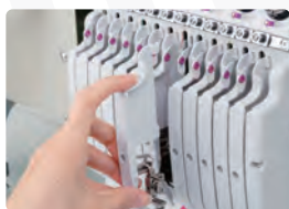
Guía de hilo medio