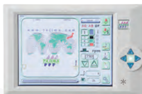
Panel de Operación Touch