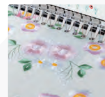
Fácil de enhebrar