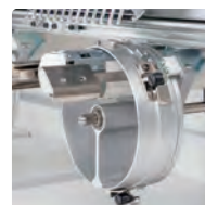
Bastidor Gorras Ancho reforzado