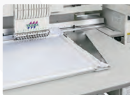
Bastidor Plano reforzado