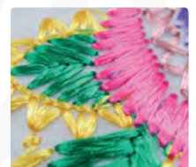
Mejor estabilidad y calidad del bordado

INCLUYE • Instalación y capacitación • Garantía por 6 meses en mano de obra (Servicio Técnico)