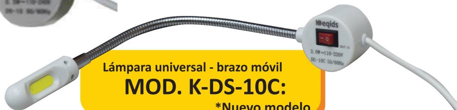
Lámpara universal - brazo móvil